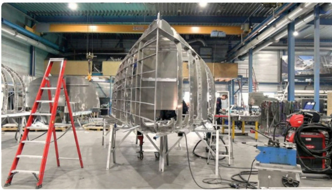
De boot begint al foarm te krijen

20 juni 2024, 13:32 • 2 minuten leestijd