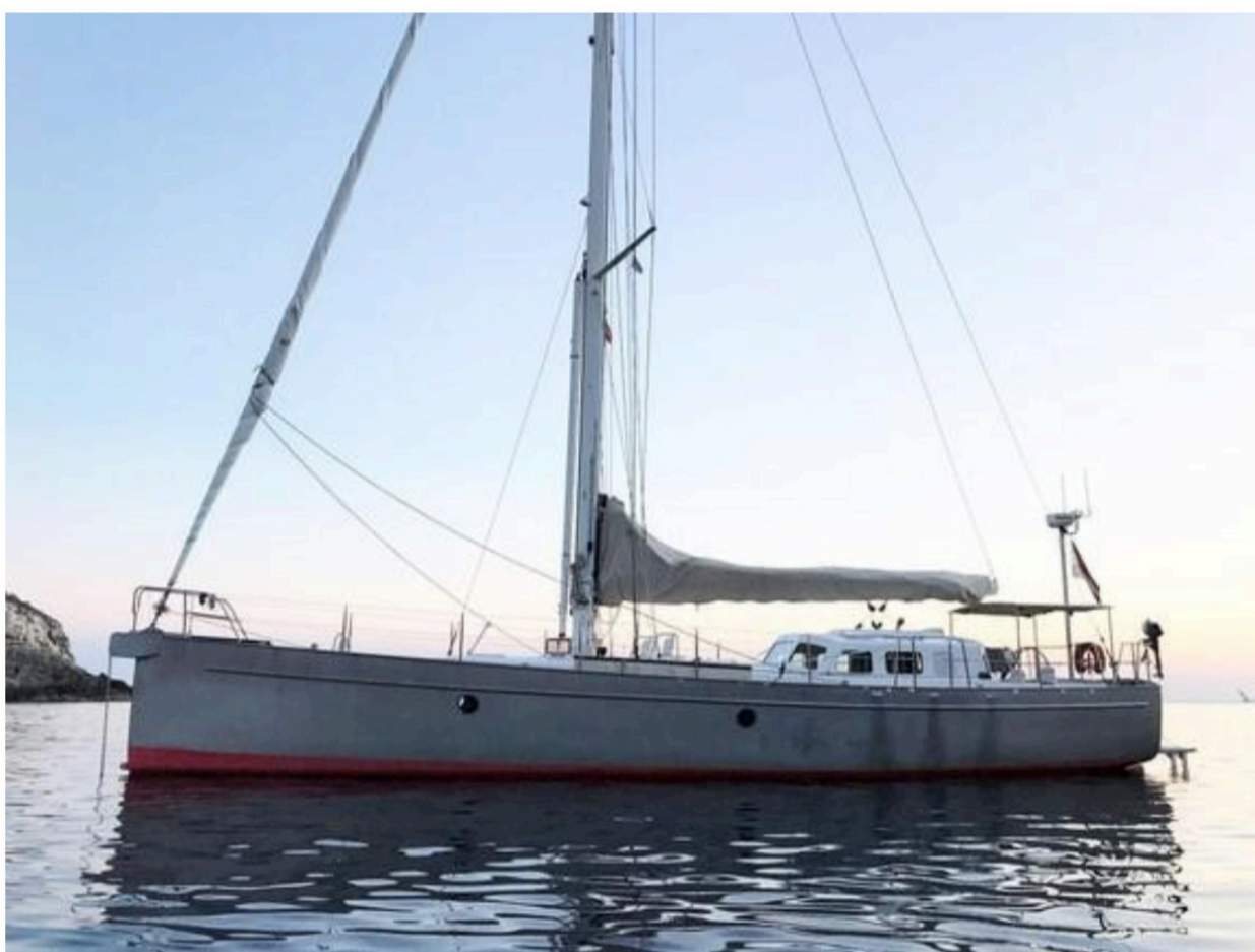
Waes investeert in een Bestevaer 53, een zestien meter lang zeiljacht.

De tv-maker tekende op zeilbeurs Boot Düsseldorf een contract voor een Bestevaer 53, een expeditieschip gemaakt uit aluminium. "Het is geen plezierjachtje. Met dit schip kan je bijvoorbeeld ook naar de Noord- en Zuidpool varen", zegt Waes. "Het belangrijkste is dat het zo'n ecologisch mogelijk schip wordt. Zeventig procent van het gebruikte aluminium zal gerecycleerd zijn. We willen elektromotoren gebruiken in plaats van dieselmotoren. Het schip zal aangestuurd worden door zonnepanelen. Er moet ook wel een noodgenerator zijn, dus het wordt een hybride vaartuig. Daar kan je niet omheen, anders is je bereik te klein om op oceanen te varen."